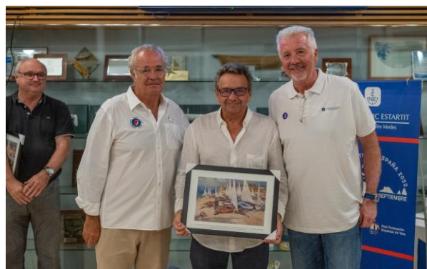
CLUB NÁUTIC ESTARITIT El port de les Illes Balears 50 CAMPEONATO ESPAÑA CLASE EUROPA 2022