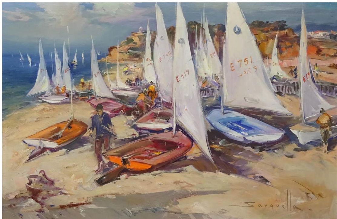
Acti Ve a

Cincuentenario del primer Campeonato de España de la Clase Europe C. N. Vilassar de Mar julio 1972 / C. N. Estartit septiembre 2022