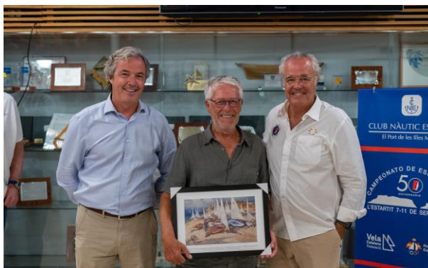
CLUB NÁUTIC ESTARITIT El port de les Illes Balears 50 CAMPEONATO ESPAÑA CLASE EUROPA 2022