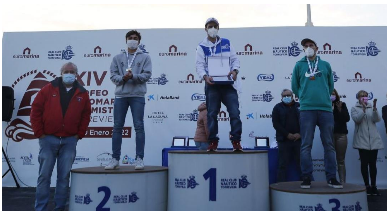
Alejandro Pareja Campeón de la Copa de España 2022